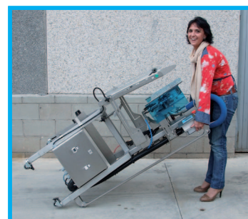
• Fácil transporte