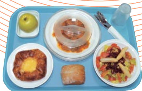
BANDEJA SELF-SERVICE CON VAJILLA EN POLICARBONATO