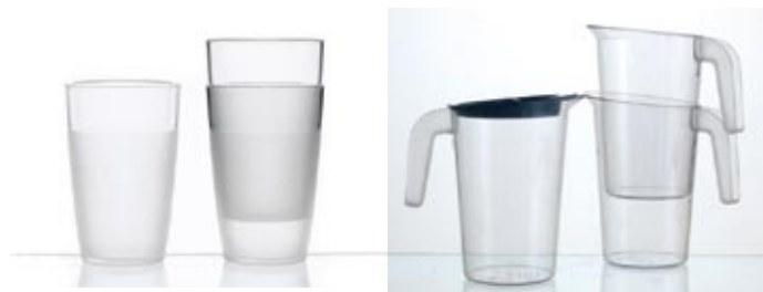
JARRAS Y VASOS EN POLICARBONATO