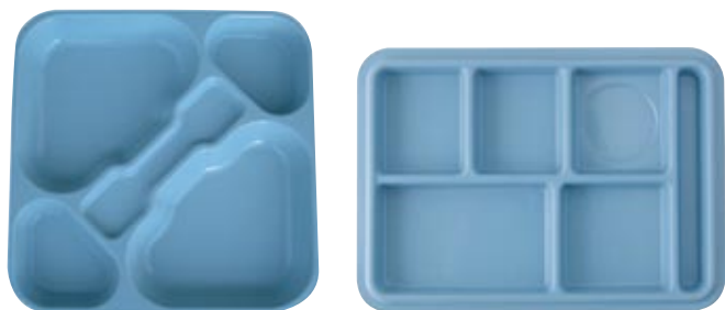
BANDEJAS DE AUTOSERVICIO CON COMPARTIMENTOS