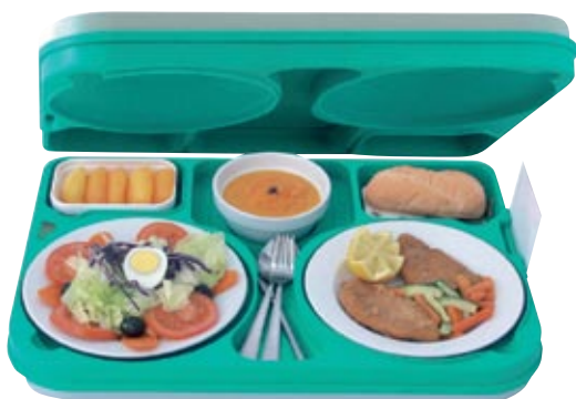
BANDEJAS ISOTÉRMICA CON VAJILLA

Todos nuestros artículos de menaje para colectividades tienen Registro Sanitario homologado