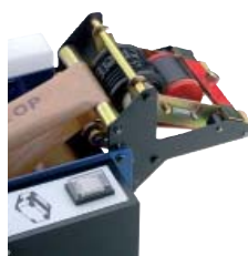
Rodillo impresor (para codificar y dispensar el precinto al mismo tiempo (fechas, números, etc.))