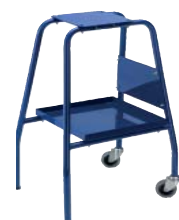
Mesa / carrito (con estante para colocar las bobinas de precinto)

Sujeto a modificaciones técnicas. ©Copyright 2008 Cyklop GmbH Protección de datos según ISO 16016