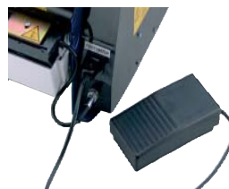
Pedal (facilita el trabajo del operario, ya que tendrá las manos libres)