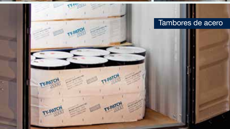
Tambores de acero