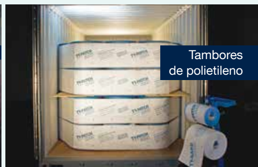
Tambores de polietileno