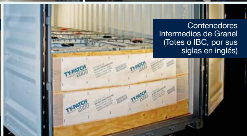
Contenedores Intermedios de Granel (Totes o IBC, por sus siglas en inglés)