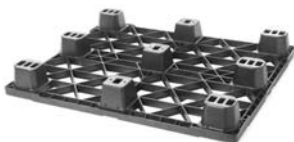
> 9 pies (9F)