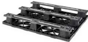
> 3 patines (3R)