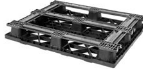
> 5 patines (5R)