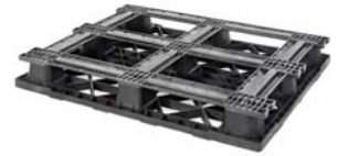
> 6 patines (6R)